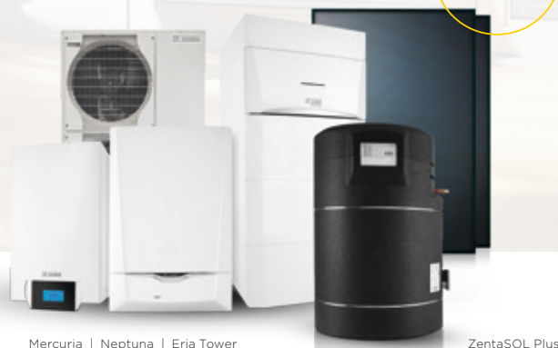
Mercuria | Neptuna | Eria Tower